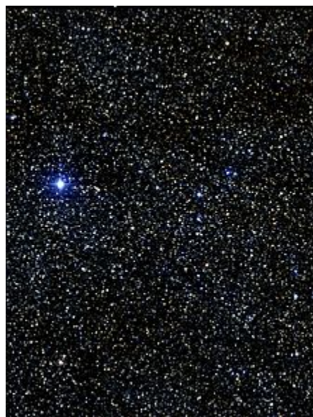
Image Atlas de l'amas du Papillon