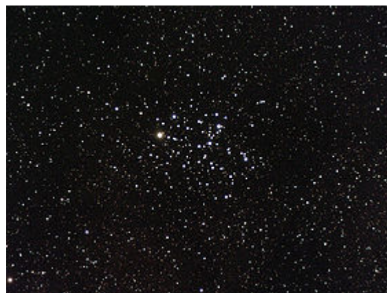
L'amas du Papillon.