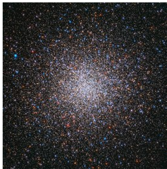
M2 vu par le télescope Hubble